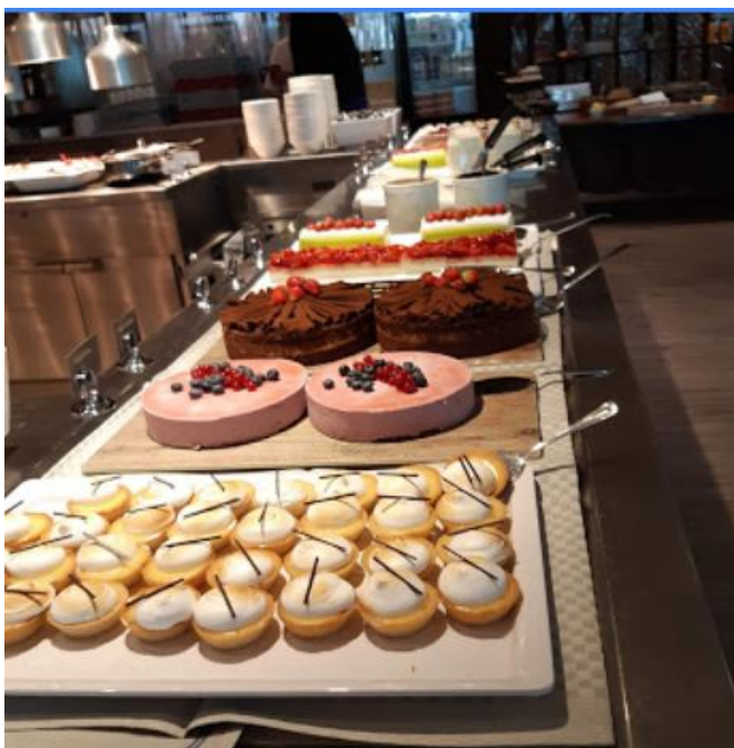
Här är några av efterätterna, glassen syns inte.

Middagen var helt utmärkt. Här fanns alla förrätter ägg, lax både gravad och rökt, läckra grönsakslådor. Bland huvudrätterna valde vi mellan kyckling, kalvfilé eller oxfilé. De som orkade tog av allt. Vin och öl ingick i priset och var bättre än väntat.